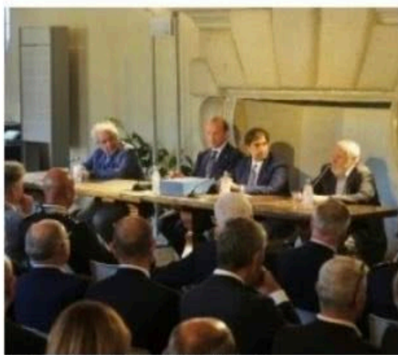
La presentazione ieri nella Sala dei Cavalli

Nel percorso di visita è stato inserito un pezzo di eccezionale valore storico, la Coppa Vanderbilt conquistata da Nuvolari nel 1936 a Roosevelt Raceway, negli Stati Uni-