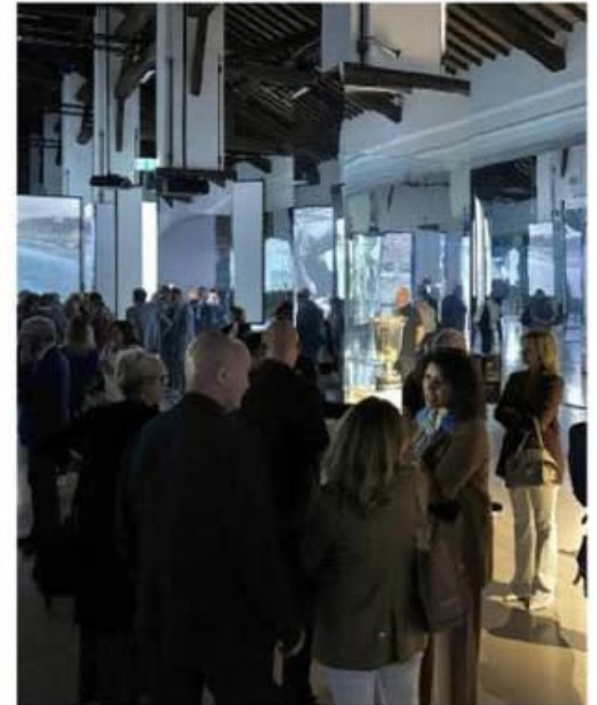
Tutti in fila I maxi schermo della mostra