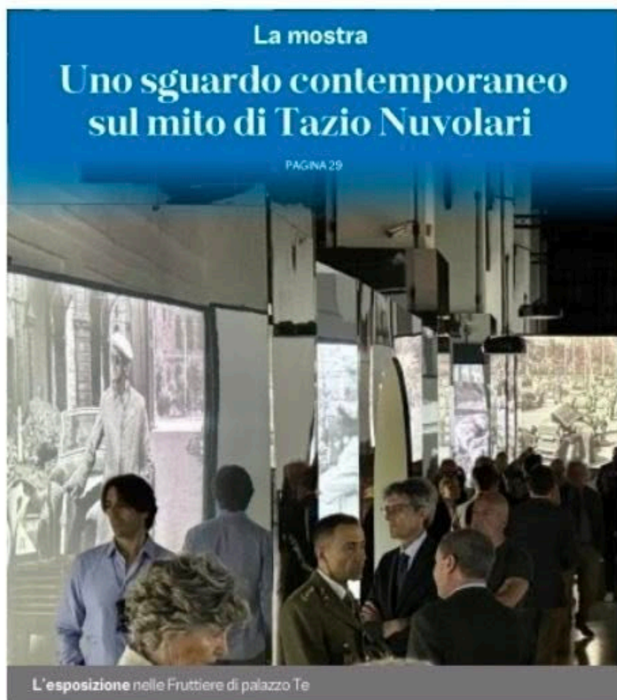
L'esposizione nelle Fruttiere di palazzo Te