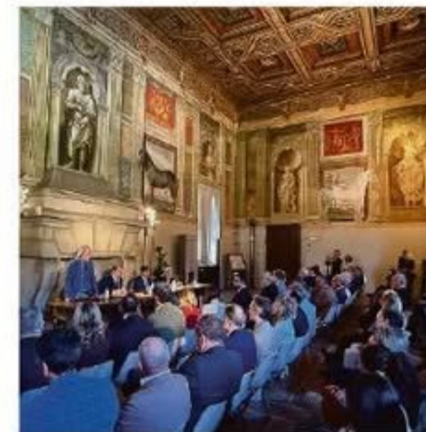
Alcune immagini della mostra di ieri a Palazzo Te