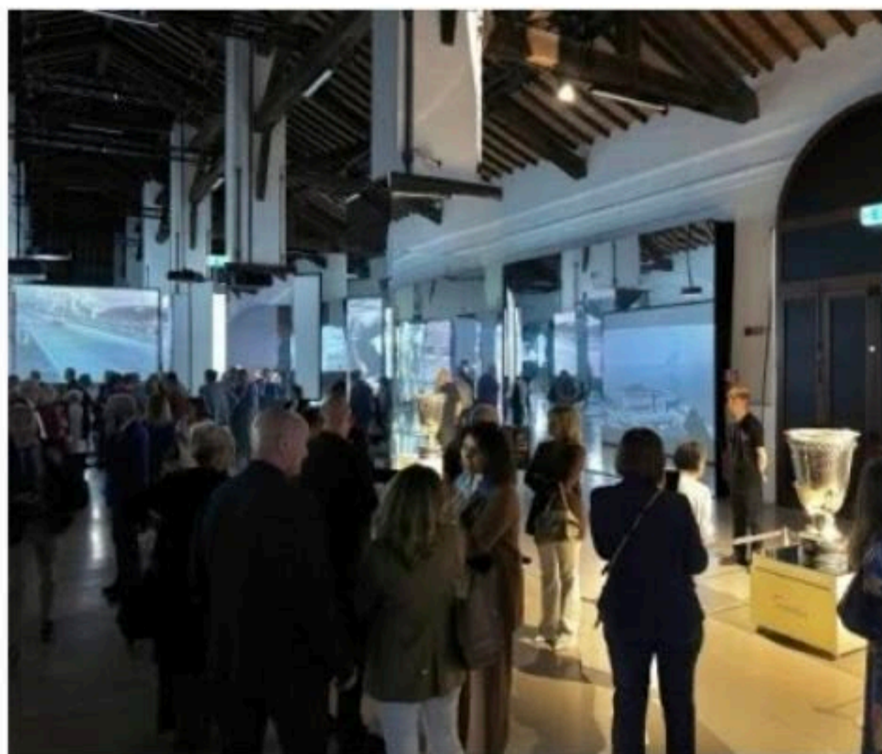
Al Te esposta anche la Coppa Vanderbilt conquistata da Nuvolari nel 1936

«Di Nuvolari conosciamo le vittorie, i record, le imprese leggendarie. - ha detto il presidente dell'Ac Mantova