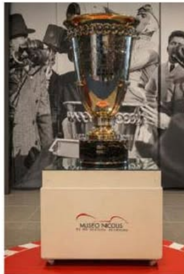
Il «gioiello» La Coppa Vanderbilt del Nicolis

L'idea «Il patrimonio motoristico non appartiene solo al passato ma continua a parlare»