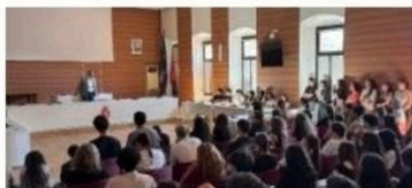
A lezioni Gli studenti di quinta dell'Istituto Gonzaga in Comune

Una lezione di educazione civica con il sindaco Enrico Volpi. E quanto l'Istituto Francesco Gonzaga ha organizzato per le classi quinte che, tra due settimane, affronteranno il nuovo esame di maturità, nel quale la materia di educazione civica sarà centrale nel colloquio. L'idea è nata dal gruppo di docenti. PAGINA 21