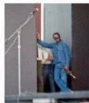
Il maestro del jazz Davis

Omaggio al jazz Apri oggi "Nei panni di Miles"