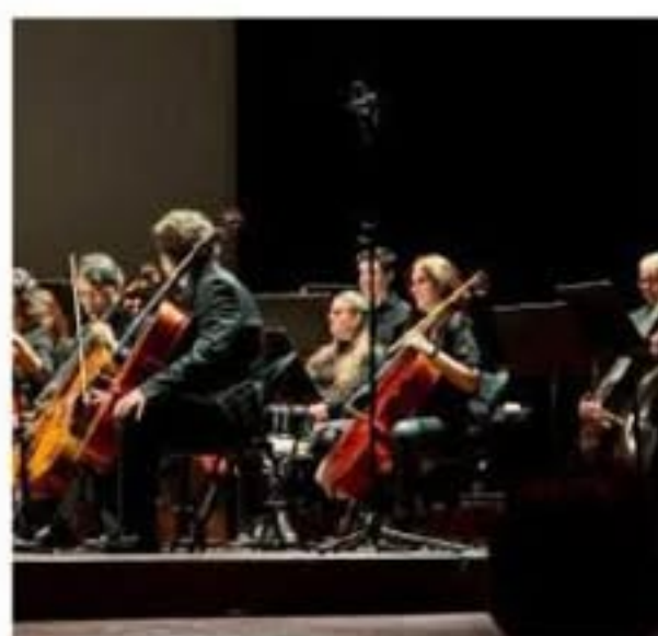
Il concerto L'orchestra dell'Università

E proprio la sinergia tra i saperi e l'integrazione Uni-