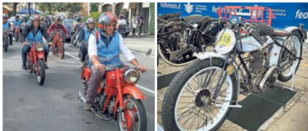
Nella foto in alto, la partenza della rievocazione della storica gara; in basso, moto d'epoca in mostra

ciato del Circuito del Tigullio, riservato alle moto costruite tra il 1922 ed il 1932.