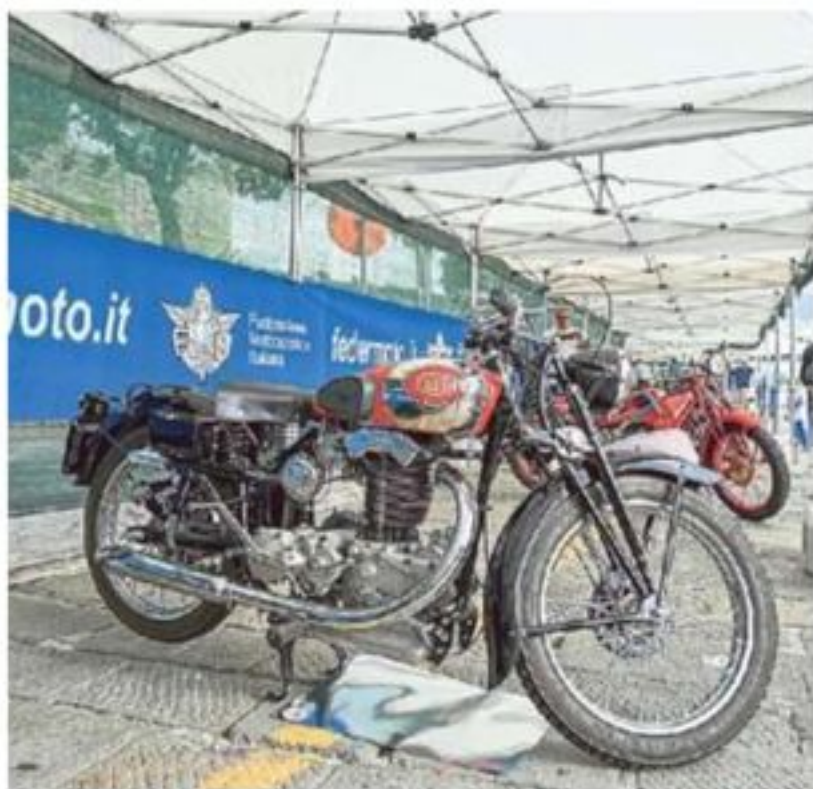
Alcune delle moto che partecipano alla rievocazione