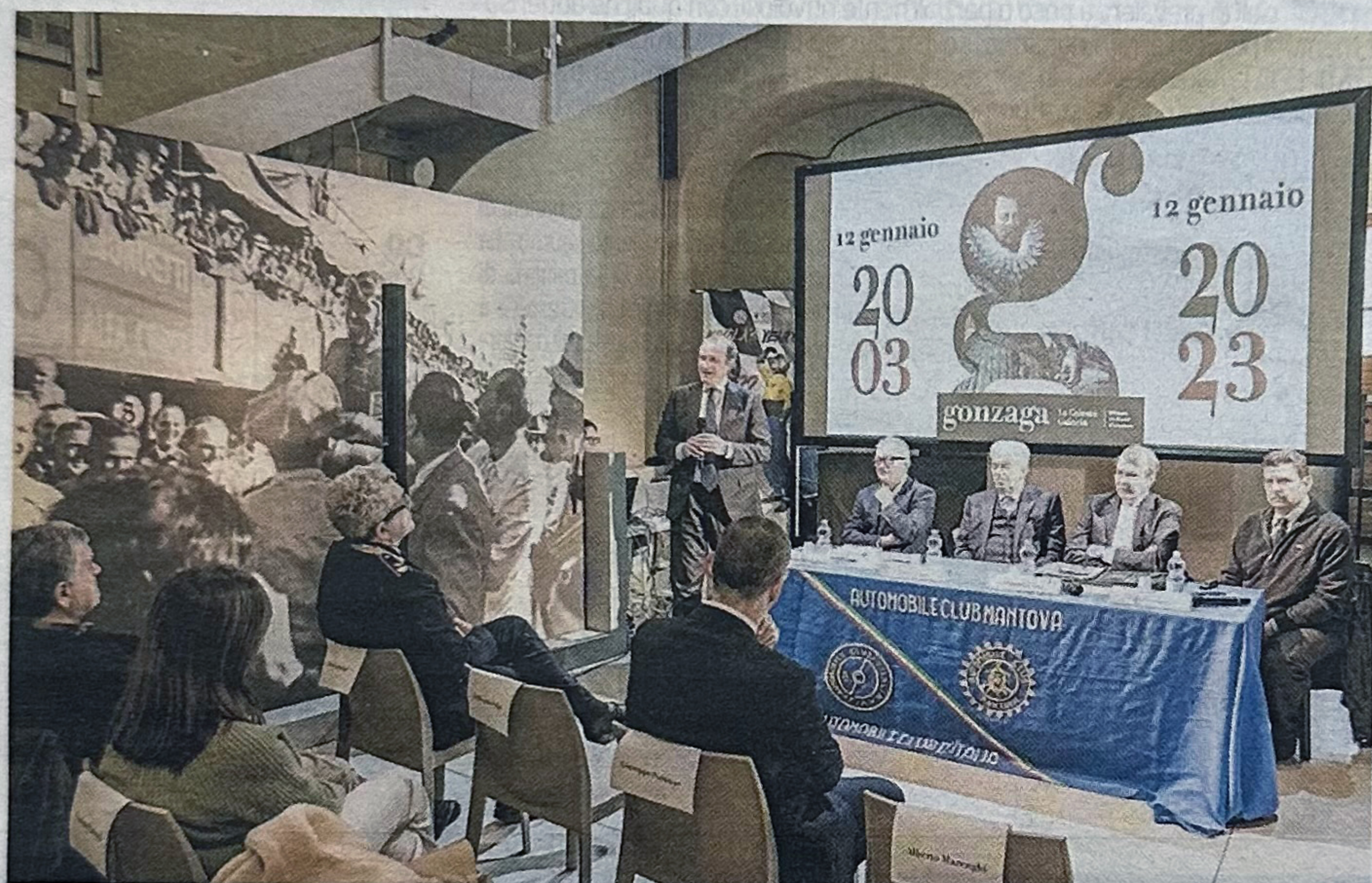
La presentazione al Museo Tazio Nuvolari